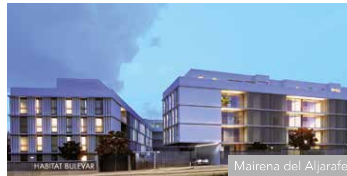
Mairena del Aljarafe