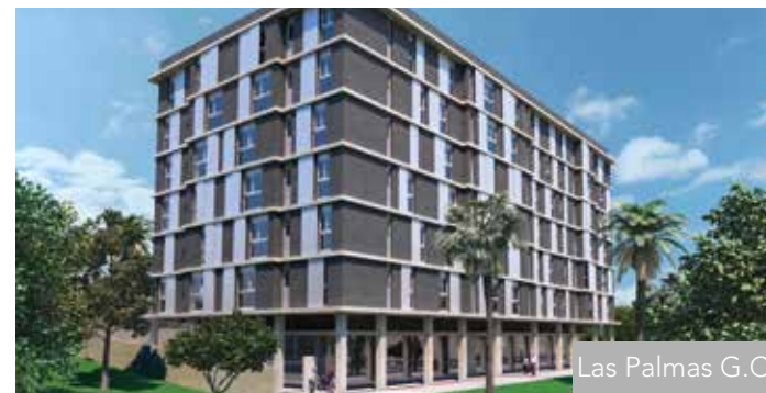
Las Palmas G.C.